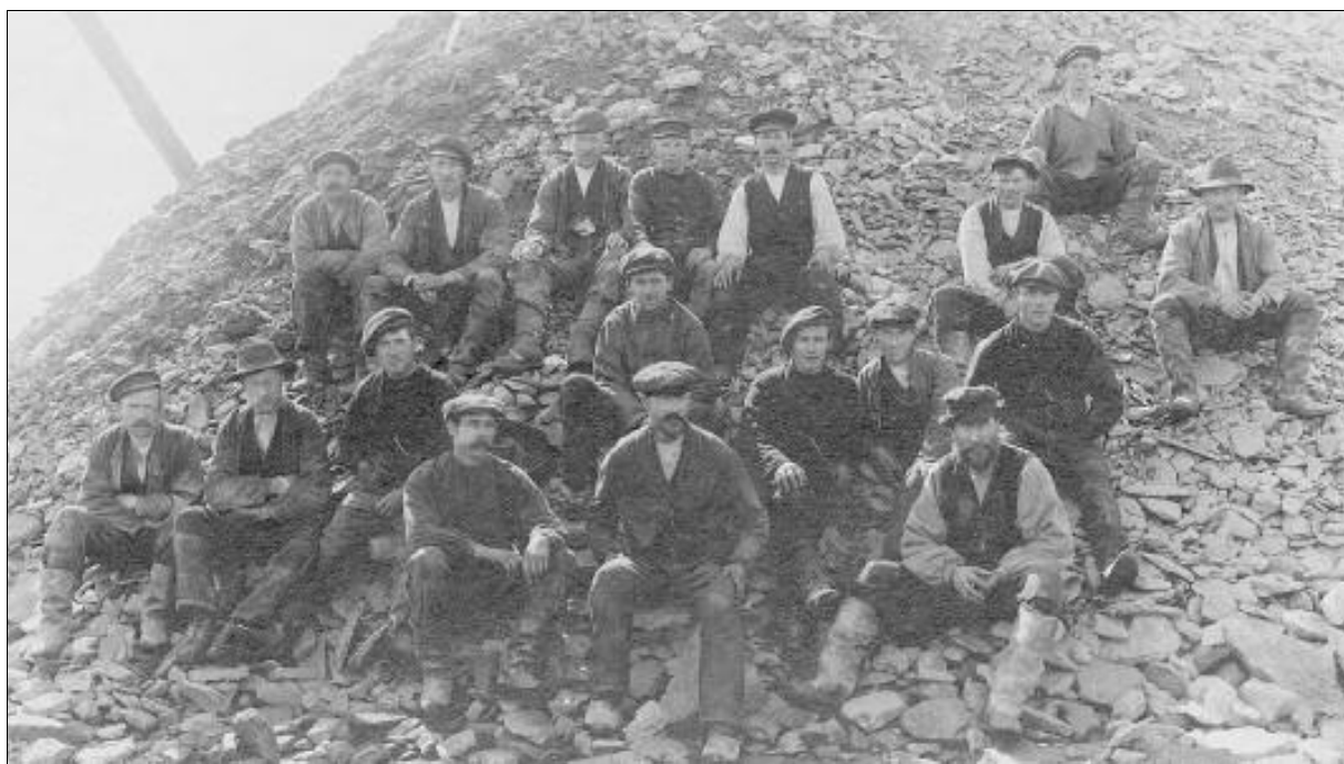
Anleggsarbeidere i Ramsågruva. Disse var trolig tilknyttet Sulitjelma AB i 1918.

Etter denne undersøkelsen kom Lundgren til at juraformasjonen på Andøya, etter de marine dyrefossiler å dømme, kan deles i en eldre avdeling, mest bestående av glimmerig sandstein med Gryphæa dilatata , Pecten valfidus , Pecten nummularis , Limæa duplicata , Perisphinctes , belemnitter , og en yngre, for det meste glimmerfattig sandstein med Aucella Keyserlingi i stor mengde; av disse burde den første avdeling svare til Europas og Moskvas Oxford, den siste skulle svare til Ruslands Øvre Volgaeta eller det midlere Europas Kimmeridge og Portland.