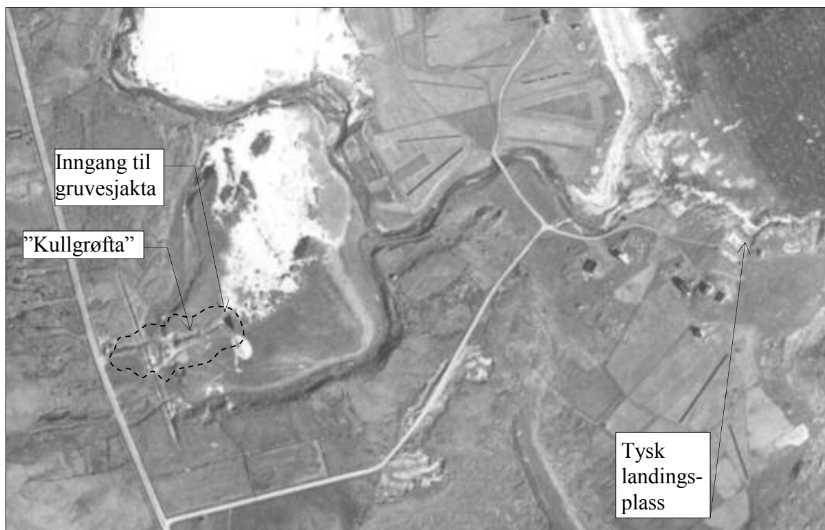
Flyfoto av Ramsåmrodet fra 1953. Her ser man situasjonen etter at tyskerne hadde gjort sitt, men rett før uttaket av oljeskifer til produksjon av bygningsstein på 1950-tallet. Omrisset av skiferuttaket (der tjernet ligger i dag) er stiplet.